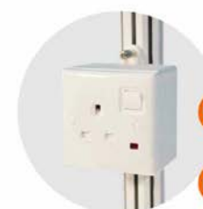
座地冷凍冰箱 (-18度)(不包括電插座) Sitting Style Refrigerator (-18°C. Excluding Socket) 1.28M(W)x0.57M(D)